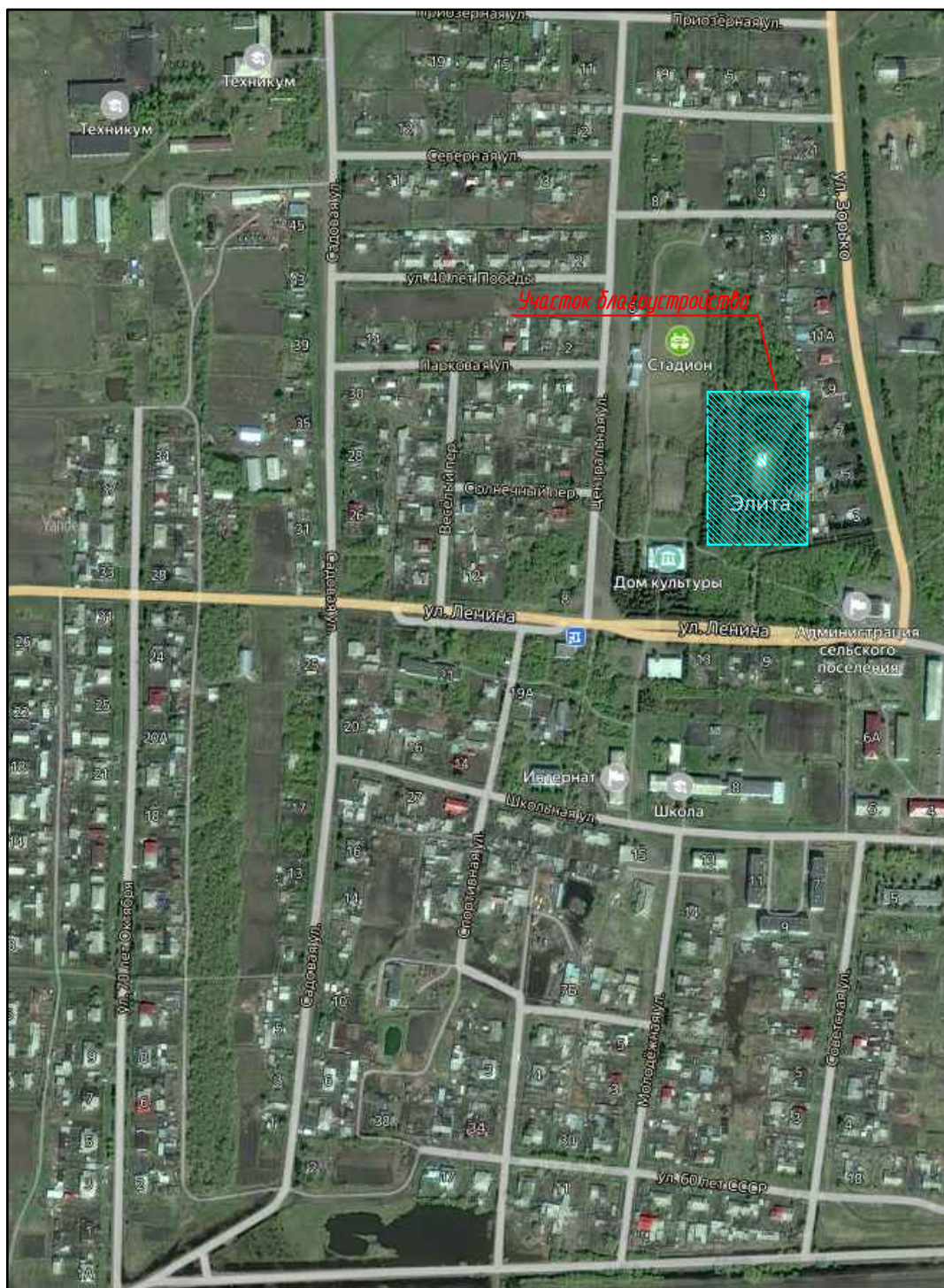
СХЕМА ПЛАНИРОВОЧНОЙ ОРГАНИЗАЦИИ ЗЕМЕЛЬНОГО УЧАСТКА Местоположение: Омская область, Москаленский район, с. Элита